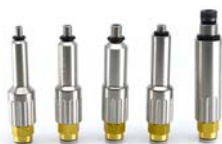
ADATTATORI MARCHE EUROPEE (dotati di sgancio idraulico rapido)